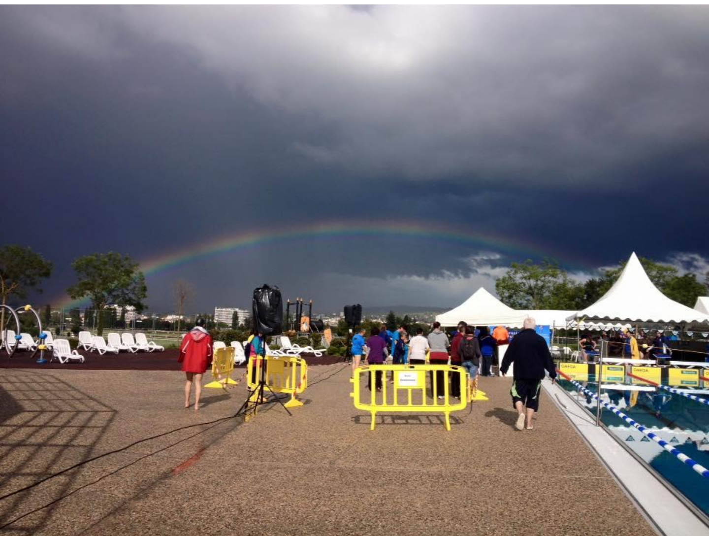
Championnat de France de natation FFSA 2016