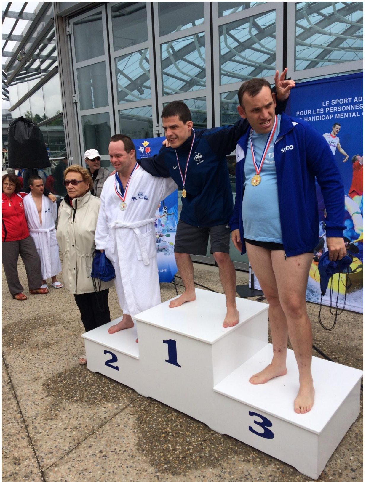
Championnat de France de natation FFSA 2016