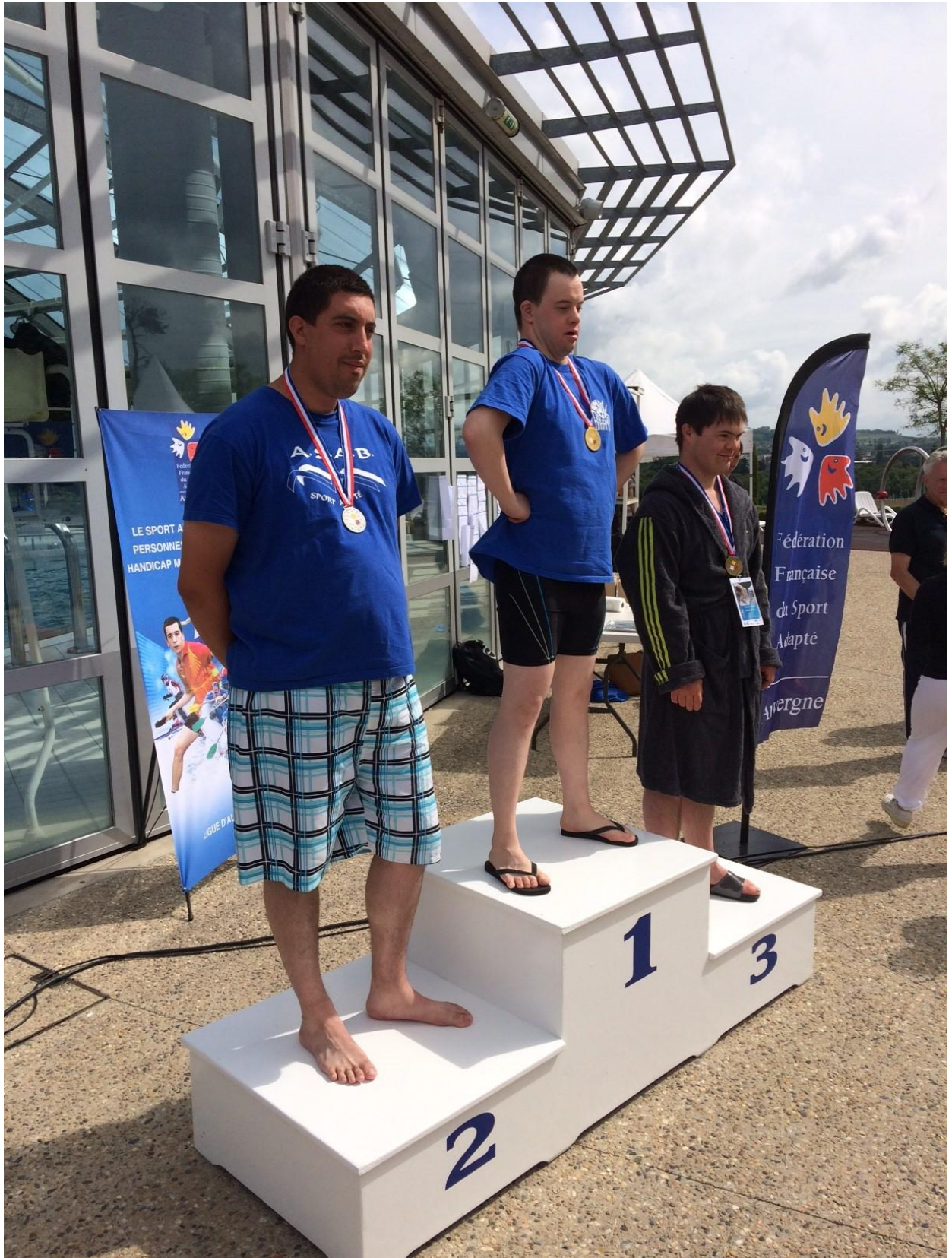
Championnat de France de natation FFSA 2016